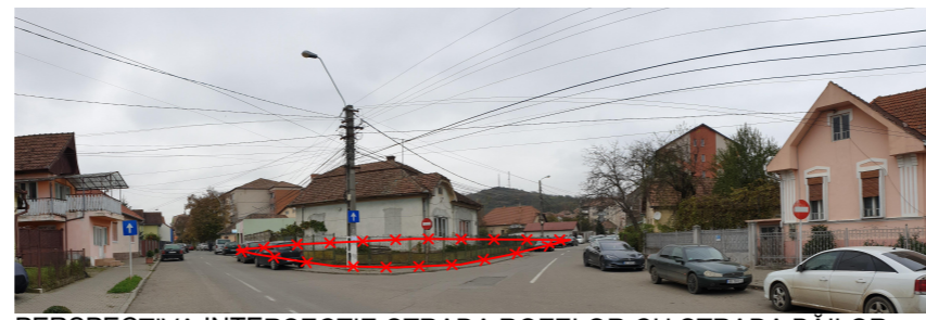
PERSPECTIVA INTERSECȚIE STRADA ROZELOR CU STRADA BĂILOR