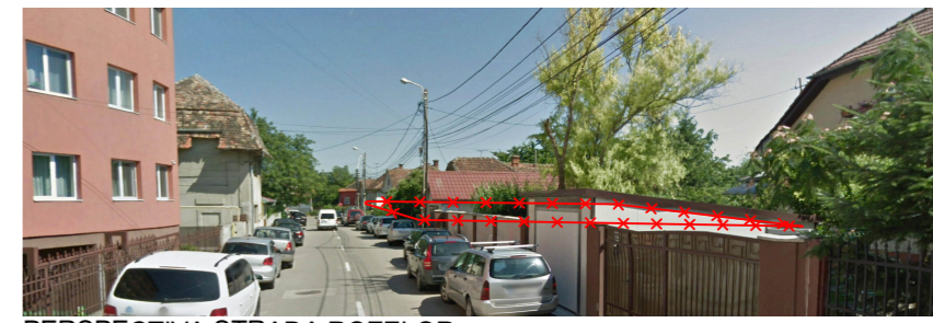
PERSPECTIVA STRADA ROZELOR