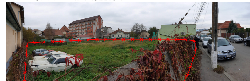
PERSPECTIVA STRADA BĂILOR