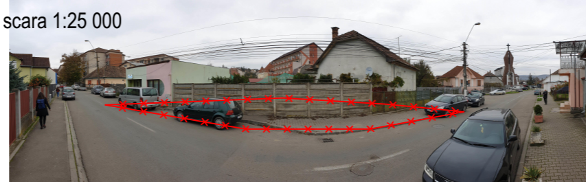
PERSPECTIVA STRADA BĂILOR