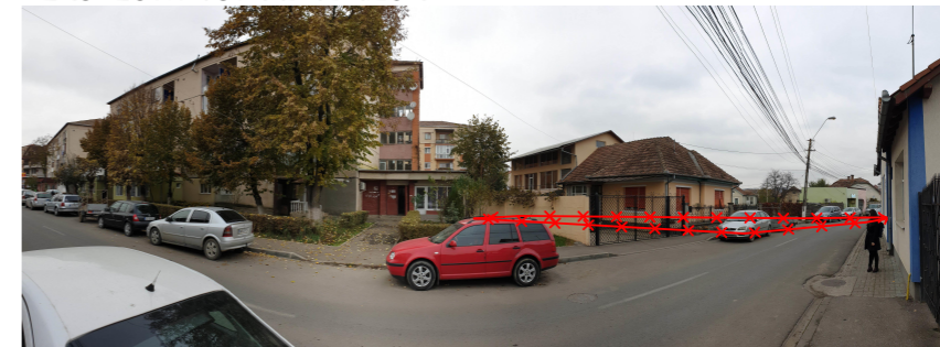
PERSPECTIVA STRADA BĂILOR